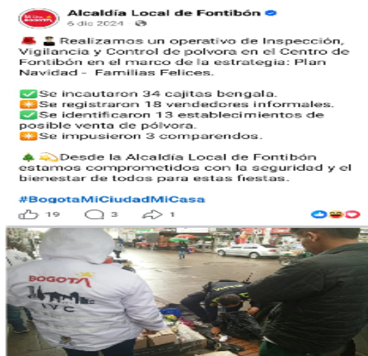
Ilustración de alguno de los múltiples operativos de IVC metalizados en el marco de Plan Navidad sin Pólvora mes temporada 2025.

En resumen, los operativos de la alcaldía local fueron fundamentales para controlar la venta de pólvora ilegal y garantizar la seguridad de la comunidad. Al decomisar productos ilegales y sancionar a los vendedores, se reduce el riesgo de accidentes y se protege a la ciudadanía, especialmente durante festividades y eventos masivos. La colaboración entre autoridades y comunidad es clave para erradicar este problema y promover un entorno más seguro.